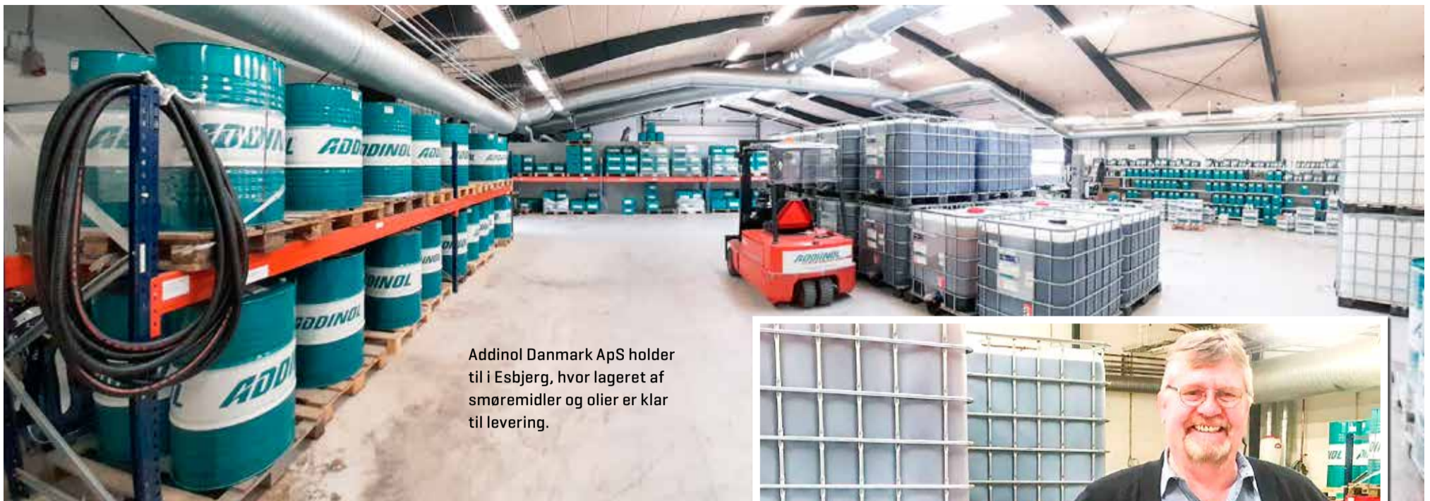
Addinol Danmark ApS holder til i Esbjerg, hvor lageret af smøremidler og olier er klar til levering.