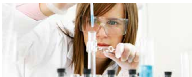
Now and then – Research and development make up a vital part of our company's core competence.