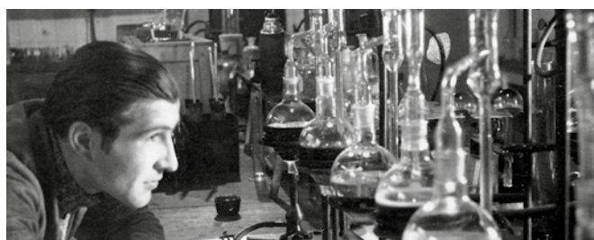
Damals wie heute – Forschung und Entwicklung gehören zu den Kernkompetenzen unseres Unternehmens.

ADDINOL bietet intelligente Lösungen, die eine optimale Schmierung sicherstellen und gleichzeitig einen verantwortungsvollen Umgang mit der Umwelt gewährleisten. Viele unserer Hochleistungs-Schmierstoffe steigern ganz entscheidend die Energieeffizienz von Anlagen und Motoren. Sie verfügen über deutlich längere Standzeiten als herkömmliche Produkte und erhöhen die Lebensdauer der geschmierten Komponenten.